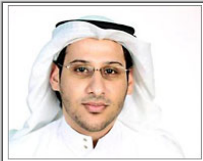
أبو الخير: قرار العلنية يأتي لتلميع صورة القضاء أمام الإعلام الخارجي (الجزيرة نت)

وقال الحقوقي للجزيرة نت إن "القرار محاولة دعائية لتلميع صورة القضاء السعودي الذي وجهت له انتقادات حقوقية دولية وعربية بسبب الممارسات القضائية، وسلطوية القضاة في التعامل مع الأحكام".