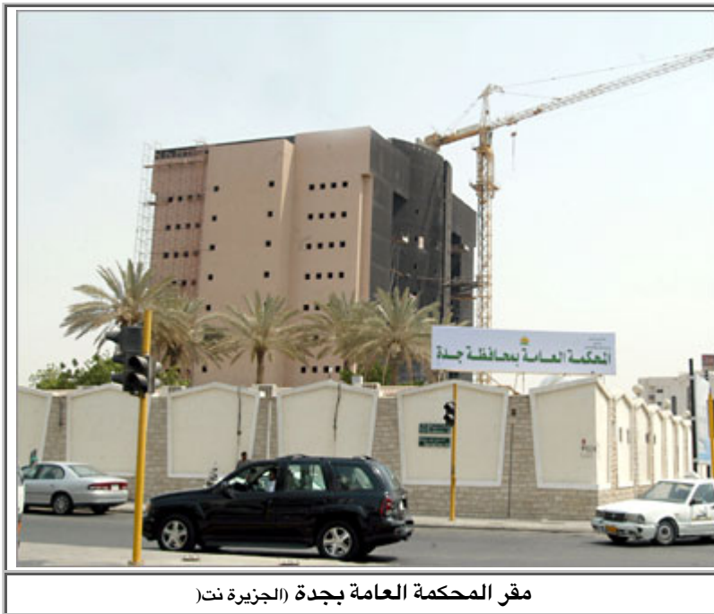
مقر المحكمة العامة بجدة

في بادرة أثارت جدلاً لأنها الأولى من نوعها في تاريخ البلاد، سمح القضاء السعودي بتطبيق قرار التصوير التلفزيوني للجلسات القضائية، كما سمح للجمهور بحضور ومتابعة الجلسات في قاعات المحاكم.